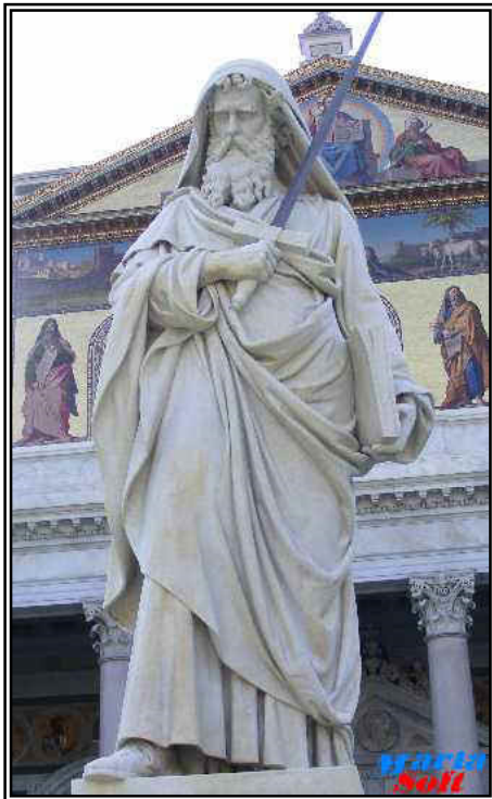
Sv. apoštol Pavol